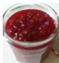
Confiture de rose

L'huile essentielle a des propriétés apaisantes, cicatrisantes et anti inflammatoires. Elle constitue également un excellent antirides. L'eau de rose, considérée comme un élixir de beauté, peut également être employé en cuisine. Elle est antispasmodique, repousse les migraines et régule l'appétit. Souvent employée dans la pâtisserie orientale, elle parfume les gâteaux, les sorbets, les confitures.