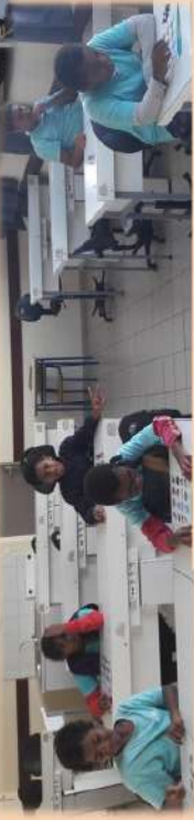
Atelier "CDI" confection d'affiches + Doodle) + QUIZZ