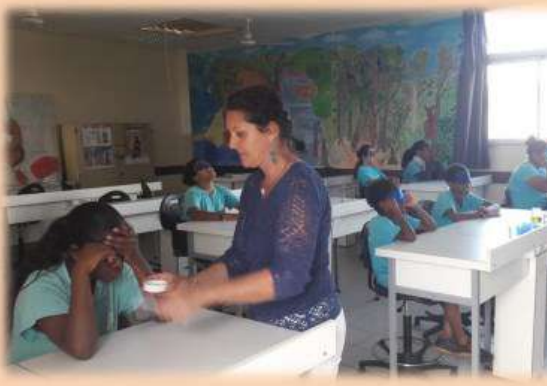
Atelier du goût avec tests à l'aveugle de différents aliments (sucrés, salés, amers, acides, épicés...)