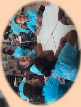
Atelier "JEUX" (Loto / Cartes / Fiches)