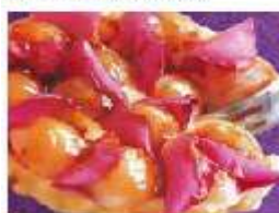
Tartlette aux pétales de roses