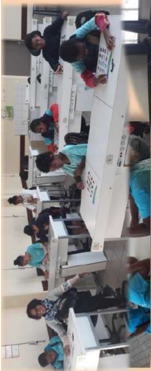
Atelier "Bingo de l'alimentation" en anglais